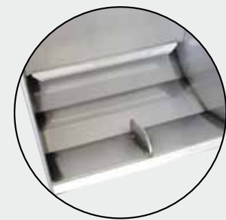
mit Schutznase gegen Wasserschlagen der Tiere