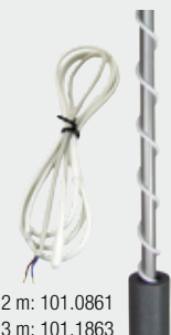
2 m: 101.0861 3 m: 101.1863