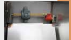
Ventil-Heizung (Best.-Nr. 131.0527)